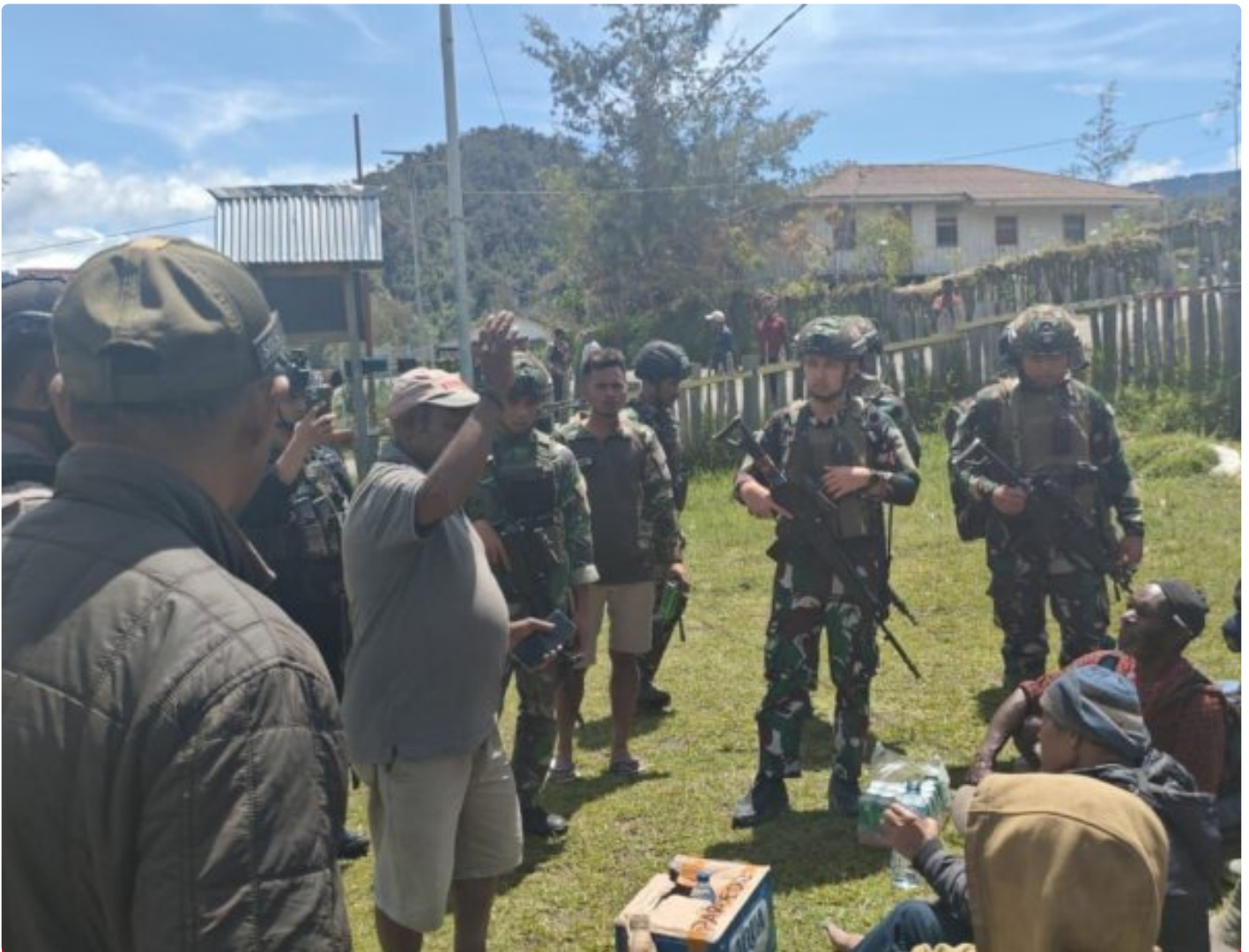
TK Sinak bersama Apkam TNI-Polri Berhasil mengamankan pekerja Pembangunan Puskesmas Sinak Barat

Satuan Tugas (Satgas) Yonif 323/Buaya Putih Kostrad berhasil mengamankan 14 Orang pekerja pembangunan Puskesmas Distrik Sinak Barat, di Kabupaten Puncak, Papua Tengah, dari ancaman kelompok bersenjata yang diduga merupakan Organisasi Papua Merdeka (OPM). Hal ini dilakukan setelah menerima laporan adanya ancaman serius terhadap keselamatan para pekerja yang sedang mengerjakan pembangunan Fasilitas umum, di Kampung