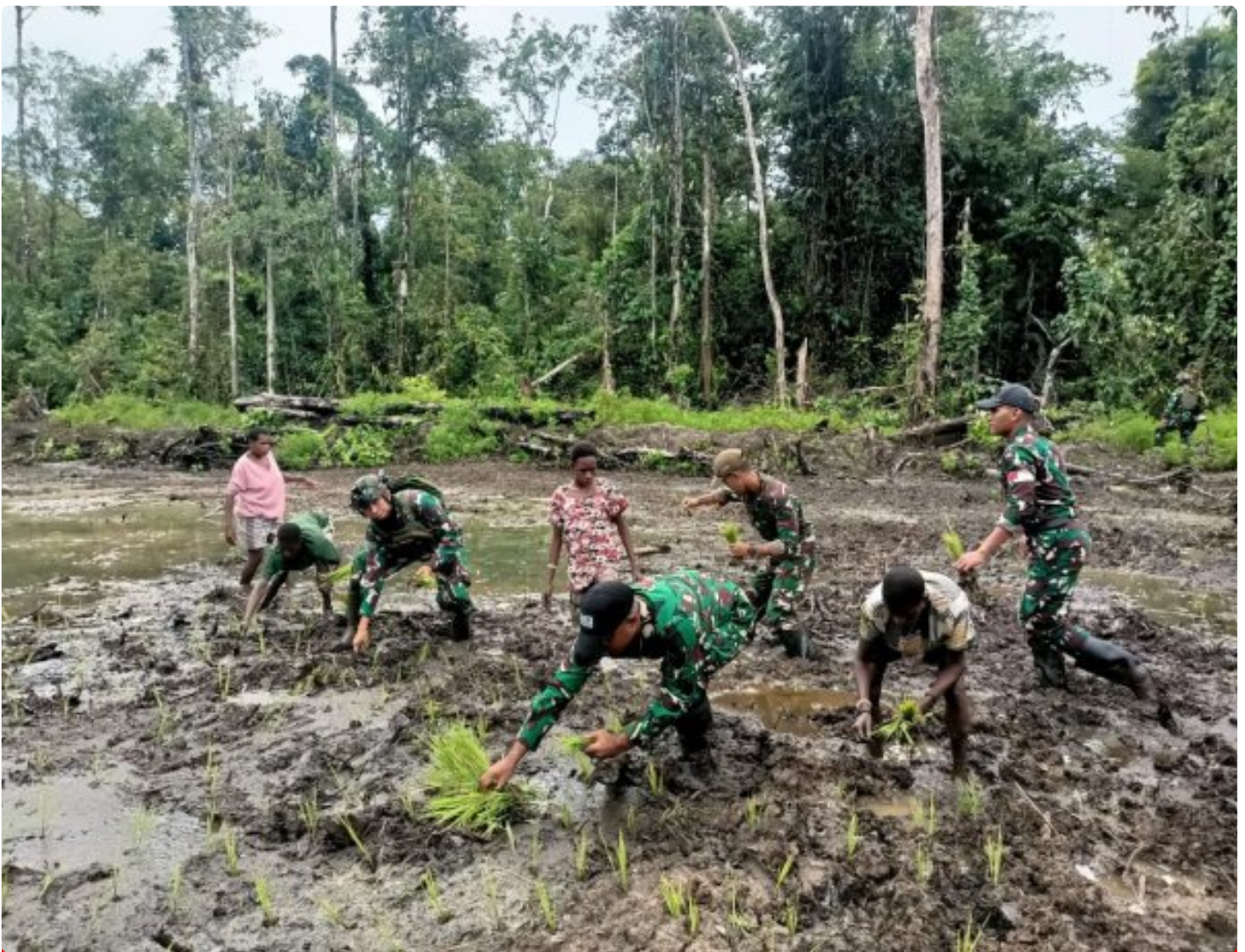
Foto: Satgas Pamtas Mobile RI-PNG Yonif 503/Mayangkara menggagas program ketahanan pangan yang melibatkan langsung warga Kampung Mumugu, Distrik Krekuri, Kabupaten Nduga, Selasa (07/01/2025).

NDUGA- Dalam upaya membangun kesejahteraan masyarakat di wilayah penugasan Papua Pegunungan, Satgas Pamtas Mobile RI-PNG Yonif 503/Mayangkara menggagas program ketahanan pangan yang melibatkan